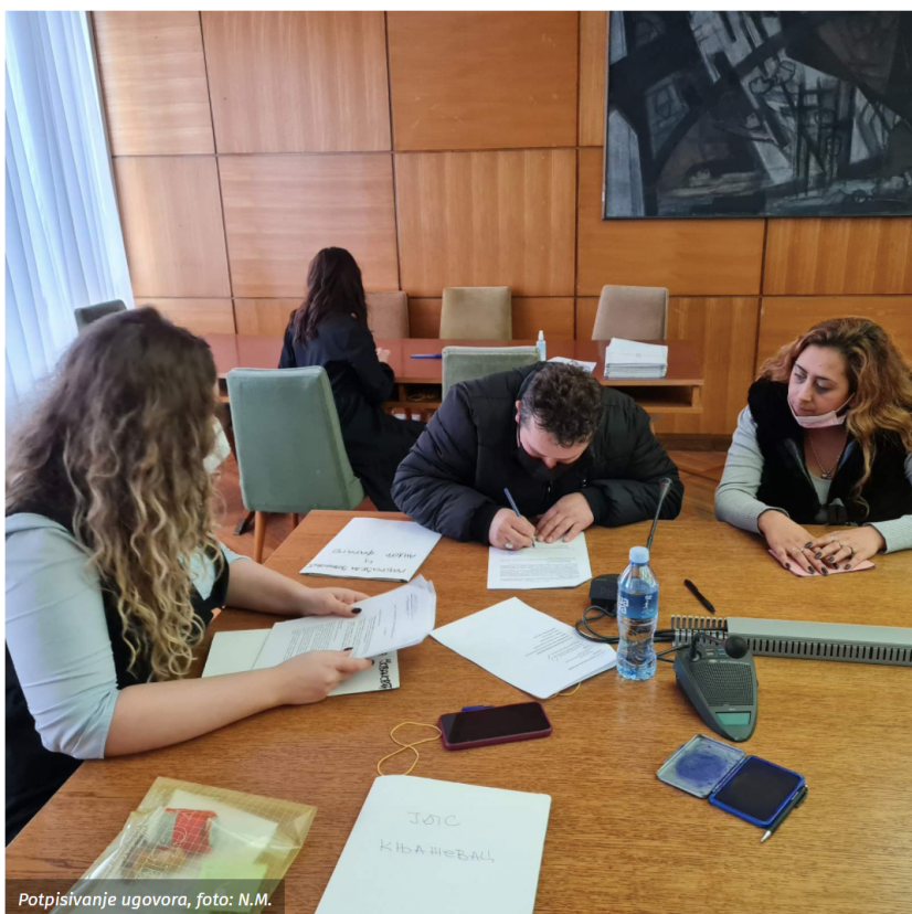
Potpisivanje ugovora

Protekle nedelje u Beogradu, u Ministarstvu za brigu o selu, potpisana su još tri ugovora o dodeli bespovratnih sredstava za kupovinu kuće sa okućnicom na selu.