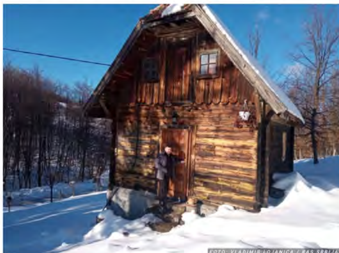
Kuću na dedovini izgradio je neko od bivših vlasnika placa